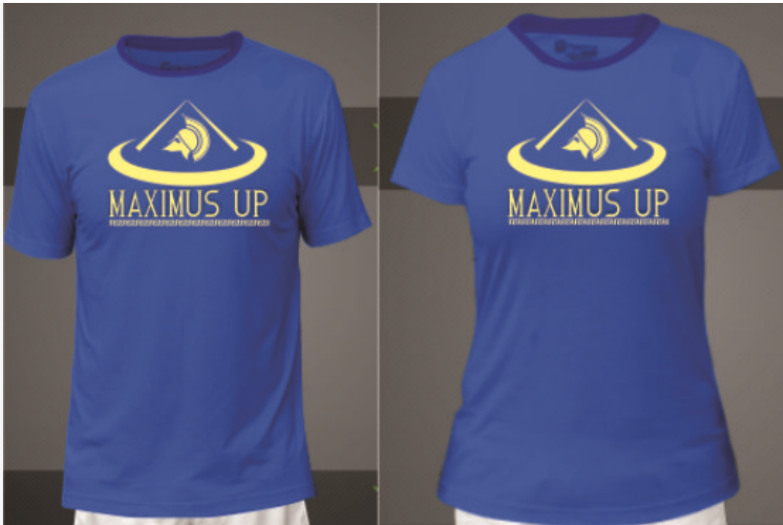
KIT MAXIMUS UP